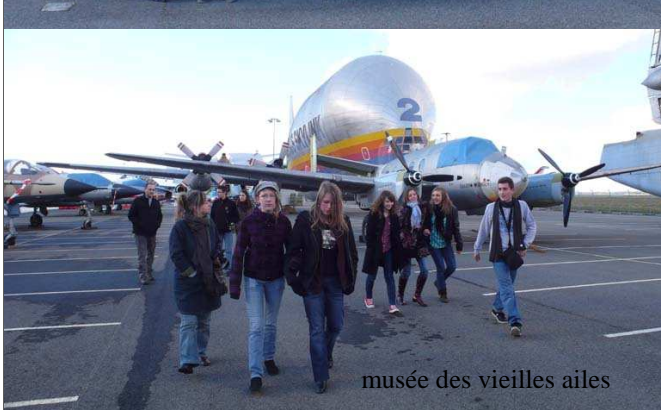
musée des vieilles ailes