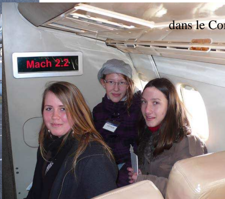
dans le Concorde