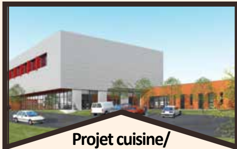
Projet cuisine/ gymnase en cours de travaux

St Jo poursuit la rénovation de ses bâtiments et de ses salles !