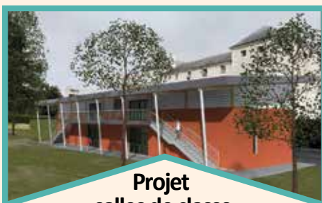
Projet salles de classe