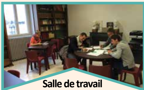
Salle de travail informatisée pour étudiants