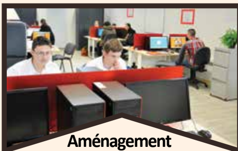
Aménagement salle informatique