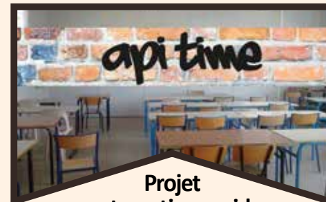
Projet restauration rapide